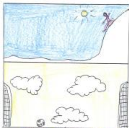
jeux d'extérieur (foot, luge...)

À l'intérieur, il y avait une petite cour, et un terrain de foot mais durant le séjour personne n'y est allé. Il y a aussi une pente pour glisser en luge.